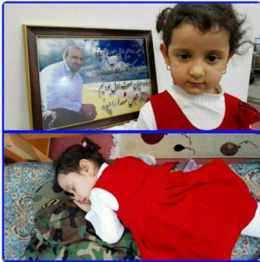
خواب شیرین دختر شهید مدافع حرم بر روی لباس رزم پدر