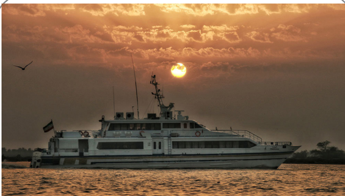
غروب زیبای خورشید در آبادان