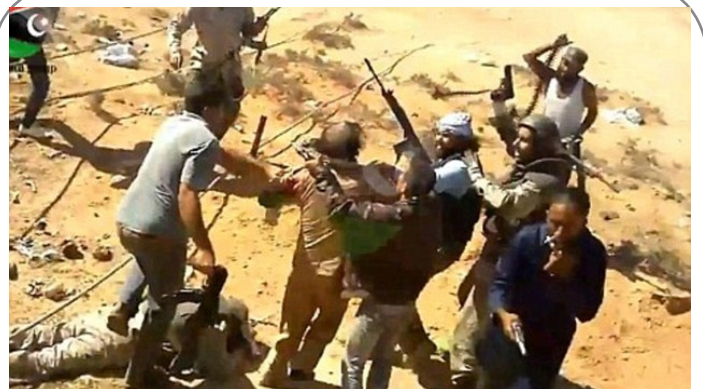
عکس جدید روزنامه دلی میل انگلیس از لحظه قبل از اعدام قذافی