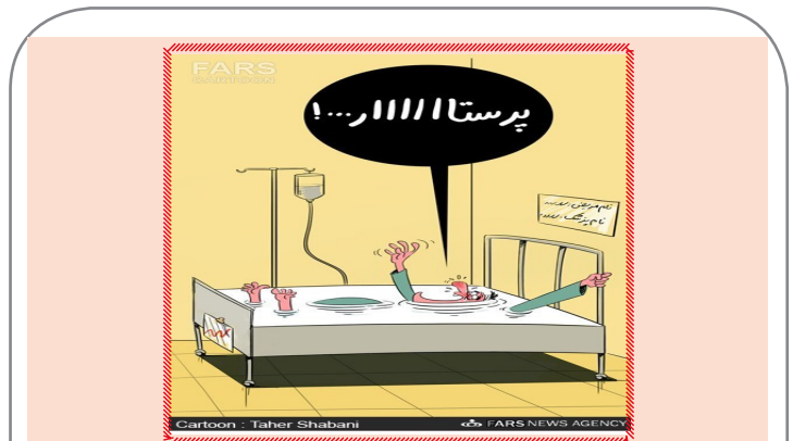
Cartoon: Taher Shabani