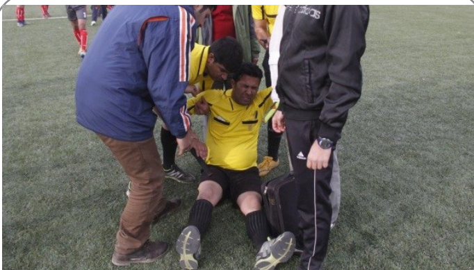
تبریز / لیگ نونهالان - بیهوشی داور به دلیل حمله تماشاچیان!