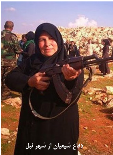
دفاع شیعیان از شهر نبل

حساب کردن روی ارتش سوریه یعنی سیطره ارتش سوریه و جنبش حزب الله و ایران روسیه بر مناطق تحت اشغال داعش. بنابراین ضمن حمایت از نیروی نظامی متحد در میدان-مانند شورشیان اهل تسنن و کردها- کشورهای عربی را تشویق به مداخله نظامی در سوریه می‌کردند. هدف نهایی آنها نیز از این سیاست جایگزین کردن نیروهای متحد خود در مناطق تحت اشغال داعش بوده است. * (متن این گزارش خلاصه شده و متن کامل در سرویس تحلیل خبرگزاری قابل دسترسی است)