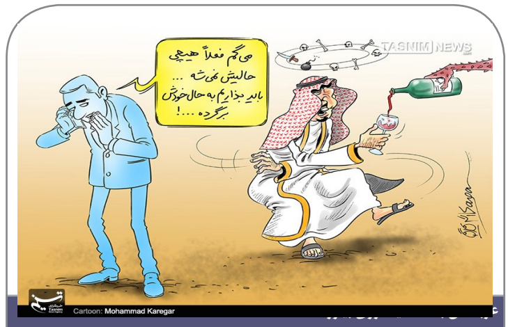
Cartoon: Mohammad Karegar