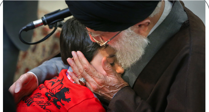
دیدار خانواده‌های شهدای مدافع حرم بامقام معظم رهبری